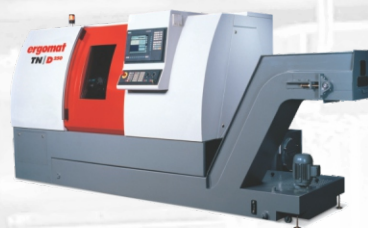
Tornos CNC ERGOMAT