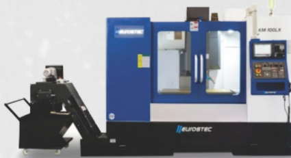
Centro de Usinagem EUROSTEC