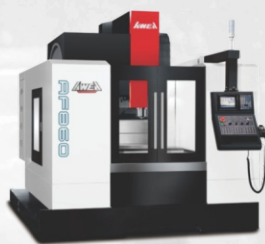
Centro de Usinagem AWEA