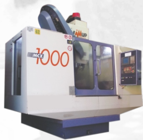
Centro de Usinagem FAMUP c/ 4º eixo